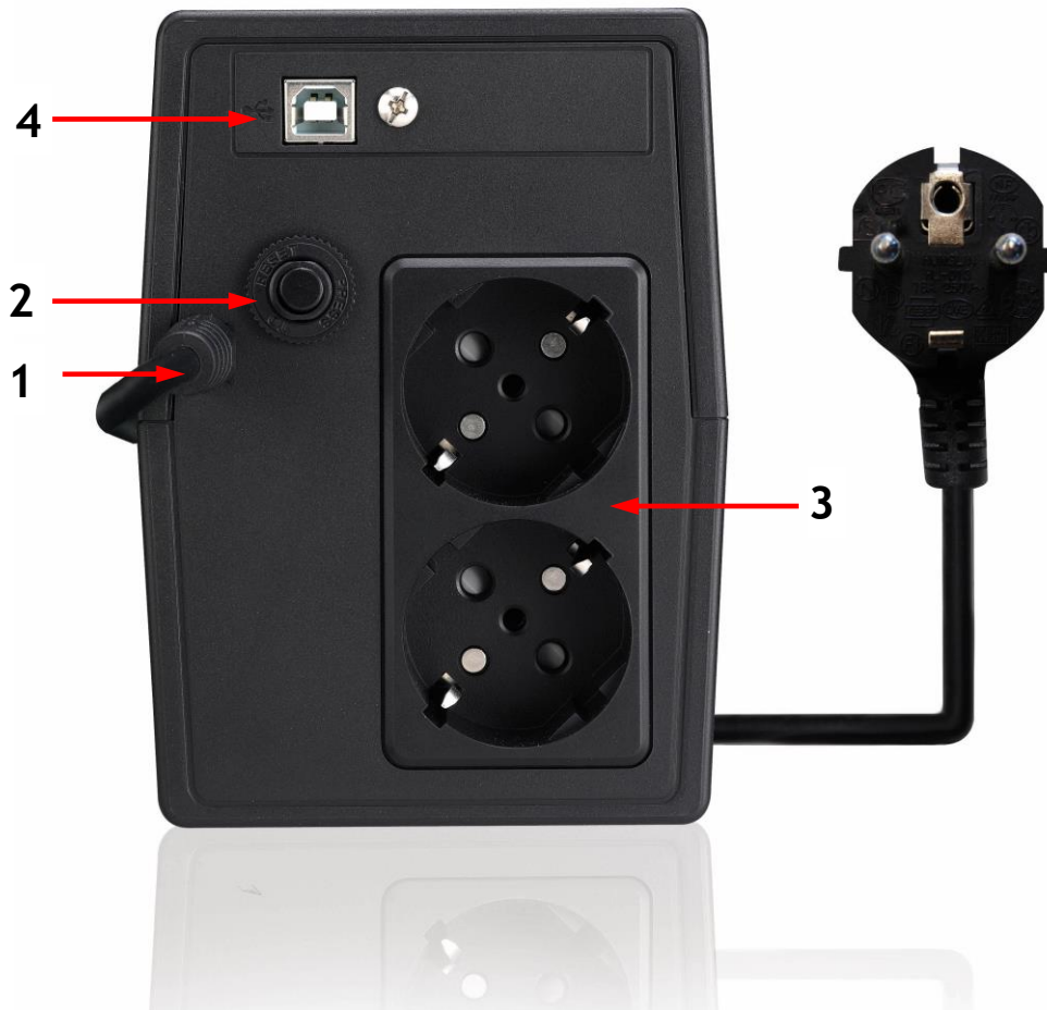
Figura 3 - Pannello Posteriore

Sul retro di ERA PLUS sono presenti (vedi figura 3):