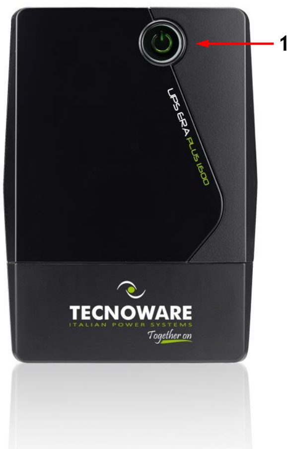
Figura 1 - Pannello Frontale